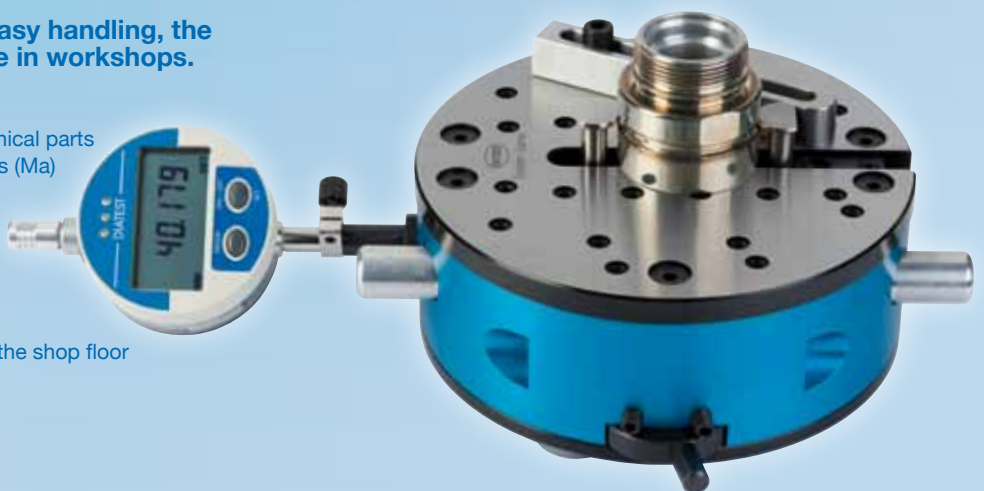
DIATEST DIA-COME C2